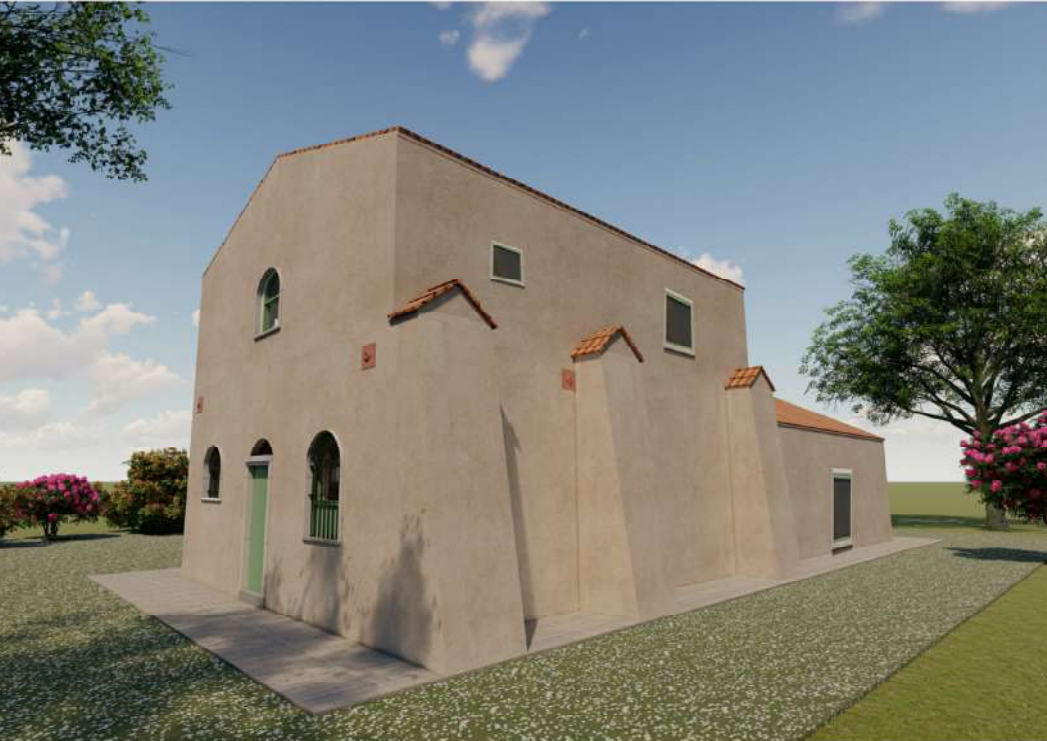
Fotoinserimento Prospetto Sud Fabbricato B Ambito Gromola