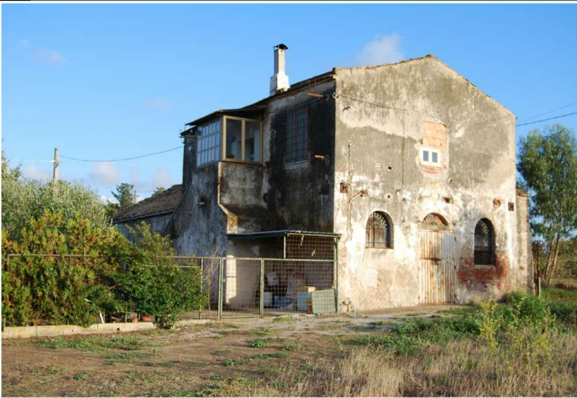
Prospetto principale Fabbricato B Ambito Gromola