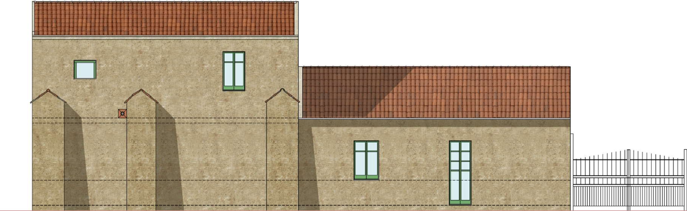
PROSPETTO OVEST scala 1.100