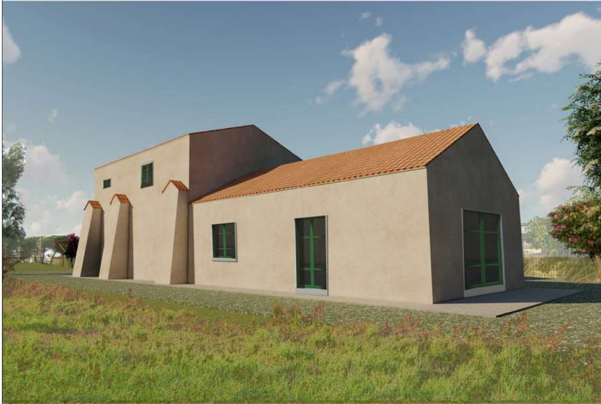
Fotoinserimento Prospetto Sud Est Fabbricato B - Ambito Gromola