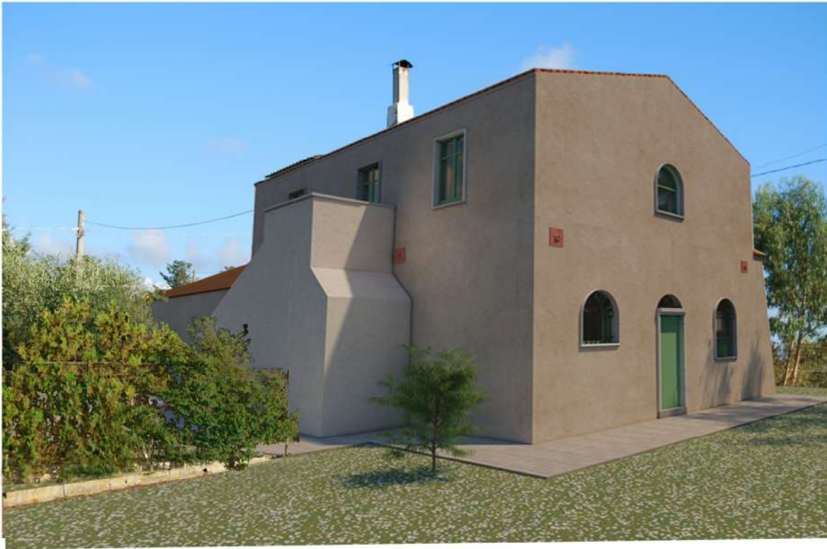
Fotoinserimento Prospetto principale Fabbricato B Ambito Gromola