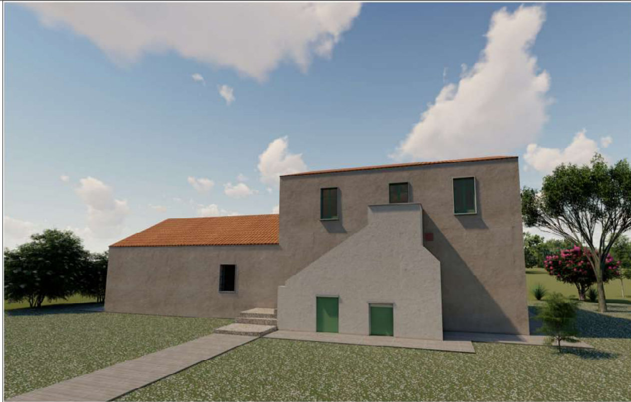
Prospetto Ingresso principale Fabbricato B Ambito Gromola

Render e simulazione grafica Fabbricato B