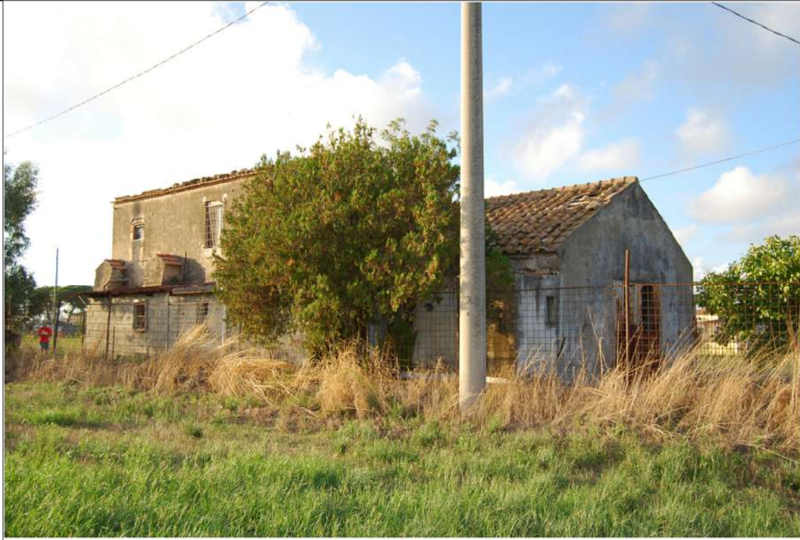
Prospetto Sud Est -Fabbricato B - Ambito Gromola