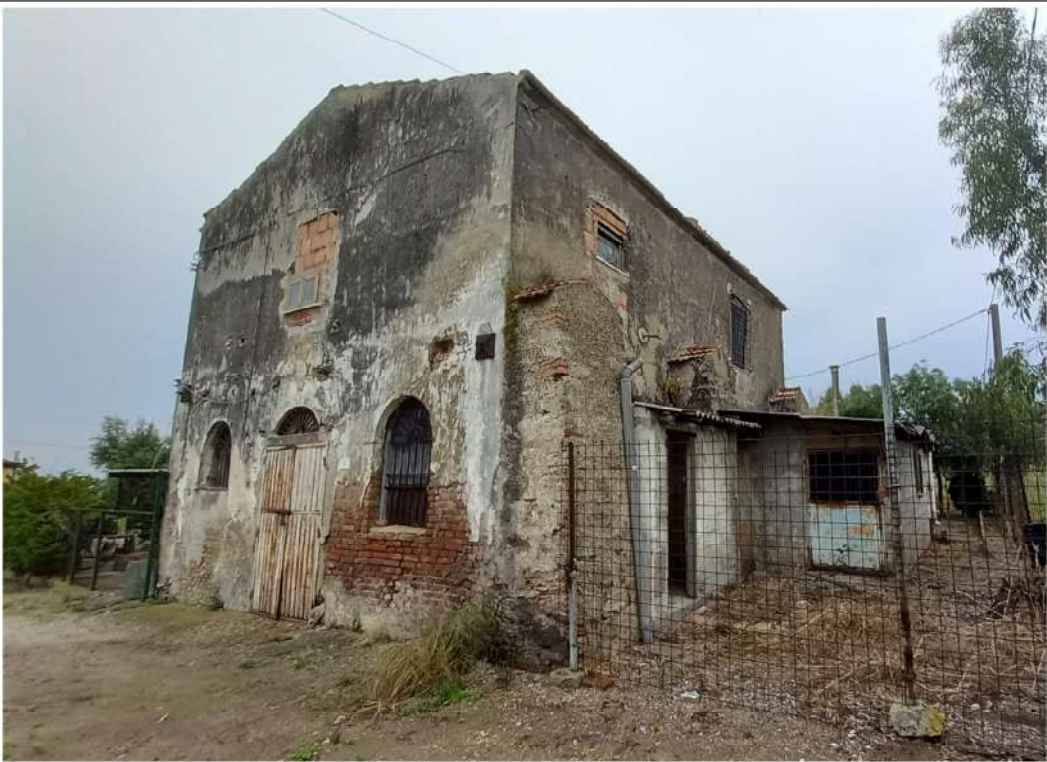
Prospetto Sud Fabbricato B Ambito Gromola